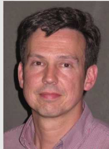
Bernie Buteneers sponsoring - clubkledij